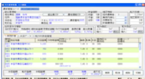
作付農地情報管理